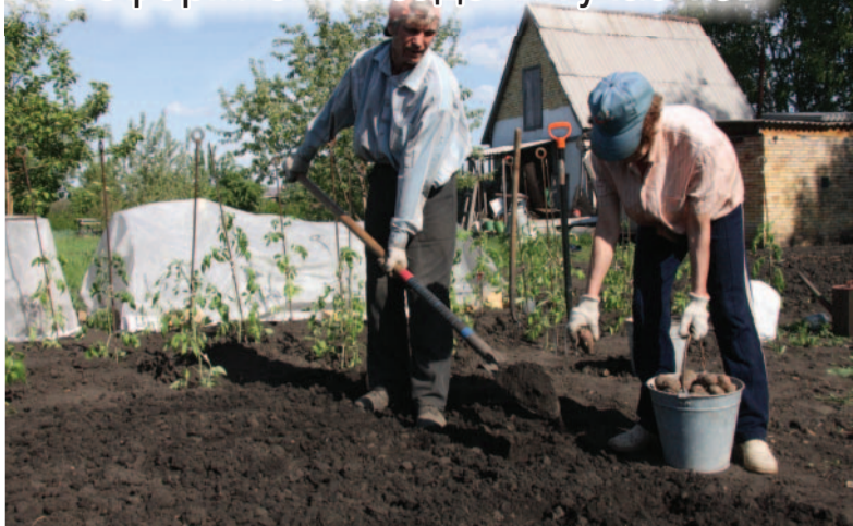
Картошка это важно, но важнее оформить участок.

- Да, бывает, что владельцы годами пользуются дачным участком, и документов, кроме садовой книжки, не имеют. Последняя не подтверждает право на объект недвижимости. Она свидетельствует только о том, что дачник входит в некоммерческое товарищество садоводов. В первую очередь для оформления дачи понадобятся документы о правах на землю. Имея их, можно далее зарегистрировать в собственность дом. До марта 2026 года собственники могут зарегистрировать права на дом в упрощённом порядке. Достаточно документов на землю и технического плана дачного участ-